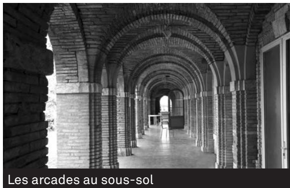
Les arcades au sous-sol