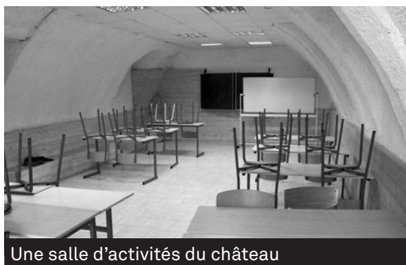
Une salle d'activités du château