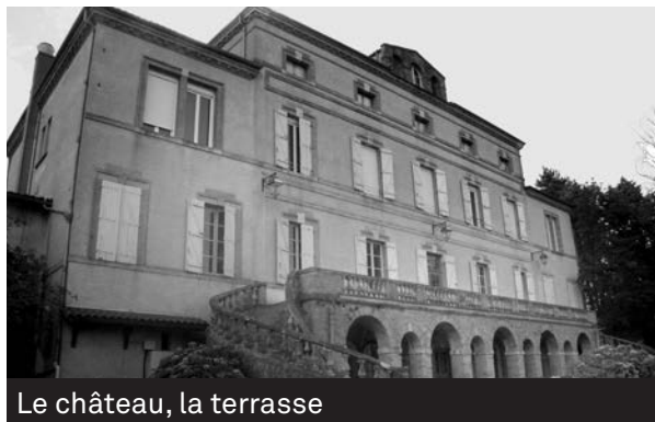
Le château, la terrasse